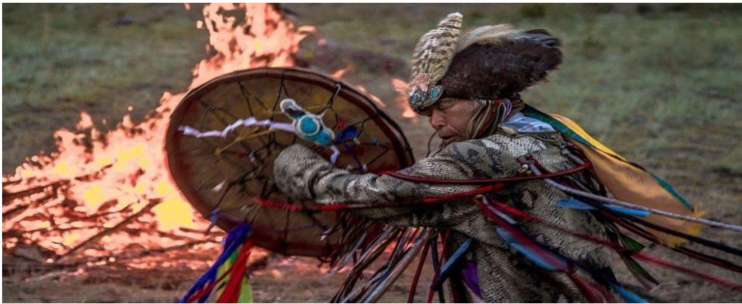
Görsel 7. Kam ateş başında performansını sergilerken İp'ten aksesuarları ile birlikte

( http://www.paragrafoku.com/2018/06/05/samanizm/Erişim Tarihi: 21.07.2019 )