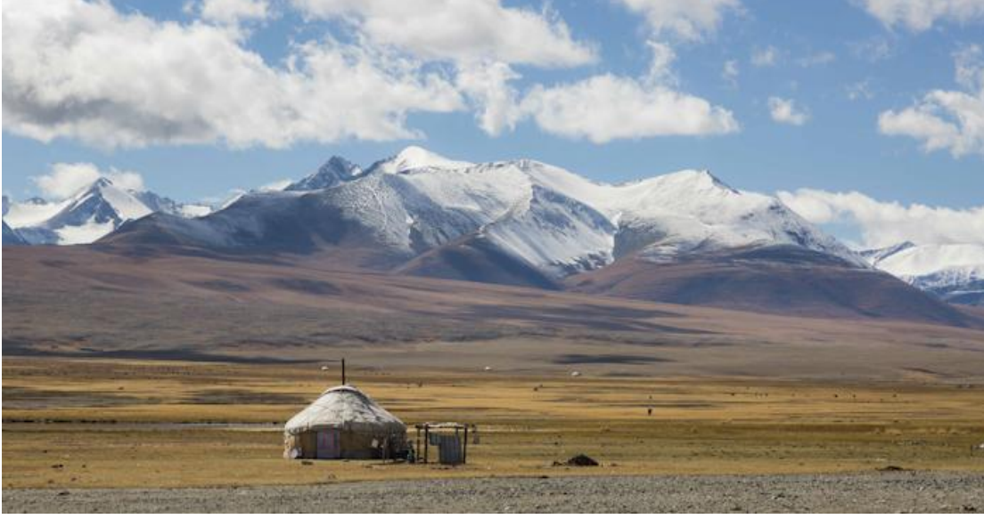
Görsel 20. Dağ ve Yamacında Otağlar