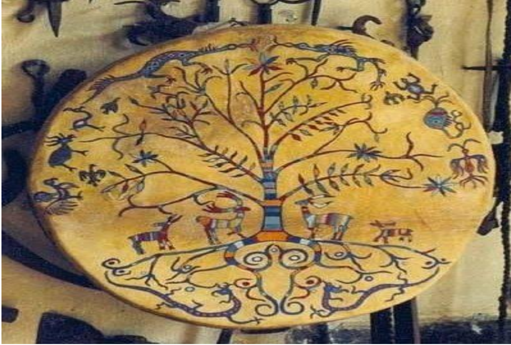
Görsel 19. Def üzerine Sembolize edilmiş yaşam ağacı ( http://www.antiktarih.com/2018/04/28/turklerde-agac-kultu-ve-hayat-agaci/Erişim Tarihi :26.06.2018 )