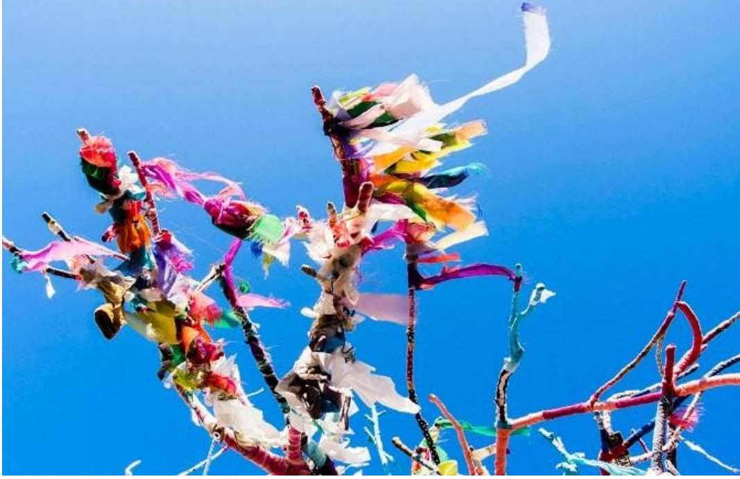
Görsel 8. Çaput bağlayarak dilekte bulunulan ağaç