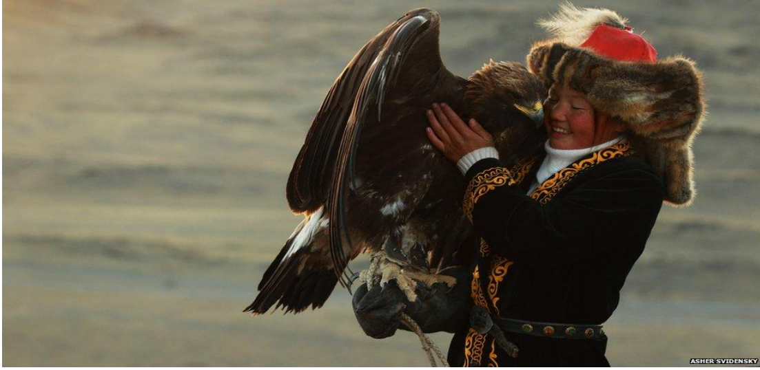
Görsel 9. Kartal ve Moğol Kadını