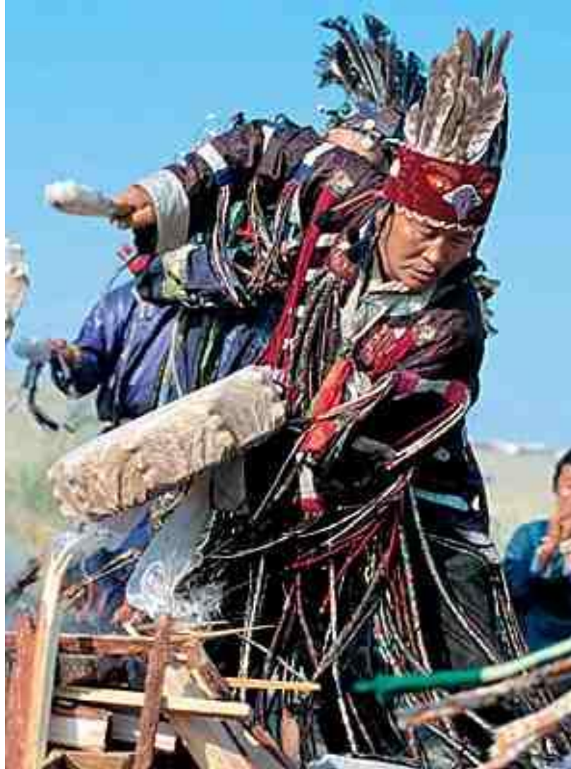
Görsel 2. Altay Şamanı ve Ayin Performansı