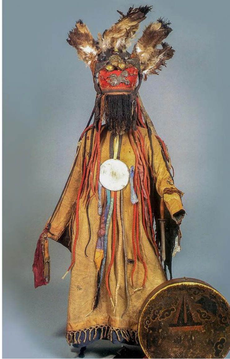
Görsel 1. Kam Kıyafet ve Aksesuarları ( https://zdergisi.istanbul/makale/saman-kozmogonisinde-at-305#images-1 Erişim Tarihi: 30.10.2018)