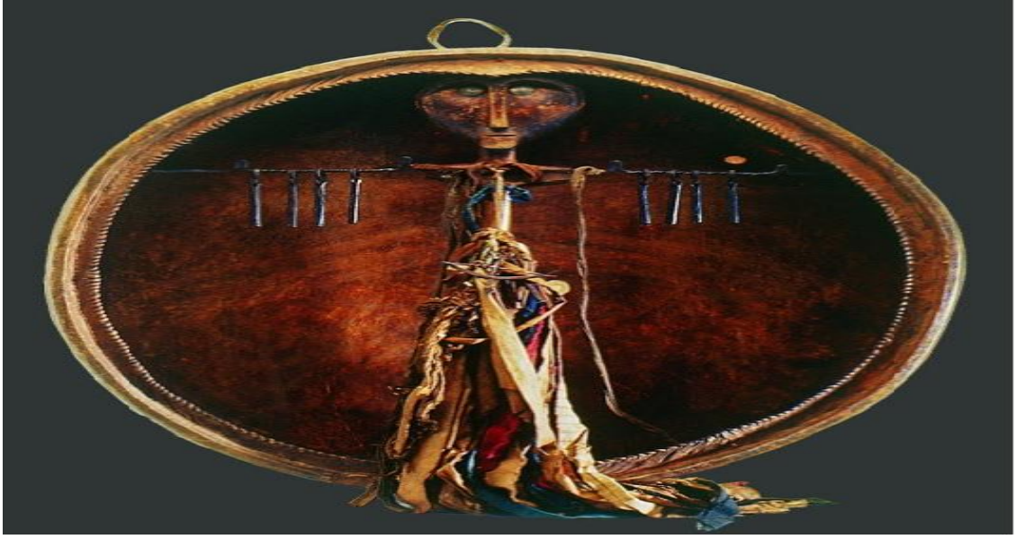
Görsel 10. Kam Davulu ( http://tengriciturkiye.blogspot.com/2016/08/saman-davulu.html Erişim Tarihi: 26.06.2018)