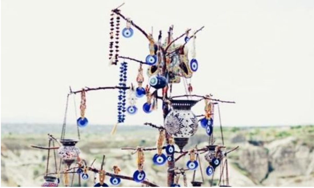
Görsel 11. Nazar Boncuklarıyla Süslenmiş Ağaç ( https://tr.pinterest.com/pin/654147914603357382 Erişim Tarihi: 26.06.2018)