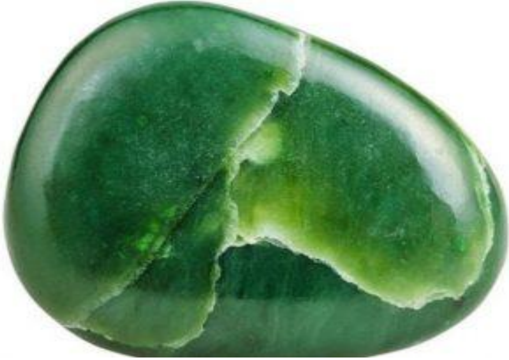
Görsel 16. Yada Taşı https://seyler.eksisozluk.com/turk-mitolojisinde-kartal-ile-ilgili-bazi-inanislar Erişim Tarihi: 26.06.2018