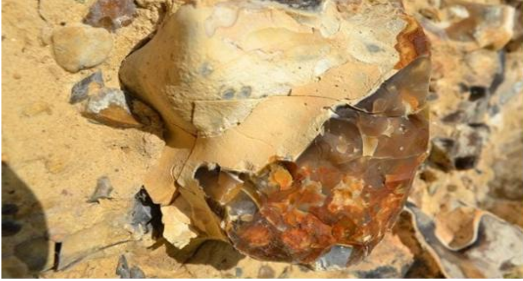
Görsel 17. Doğal ortamında çakmak taşı ( https://akiktasi.net/cakmak-tasi-nedir-cakmak-tasinin-faydolari-nelerdir/ Erişim Tarihi: 26.06.2018)