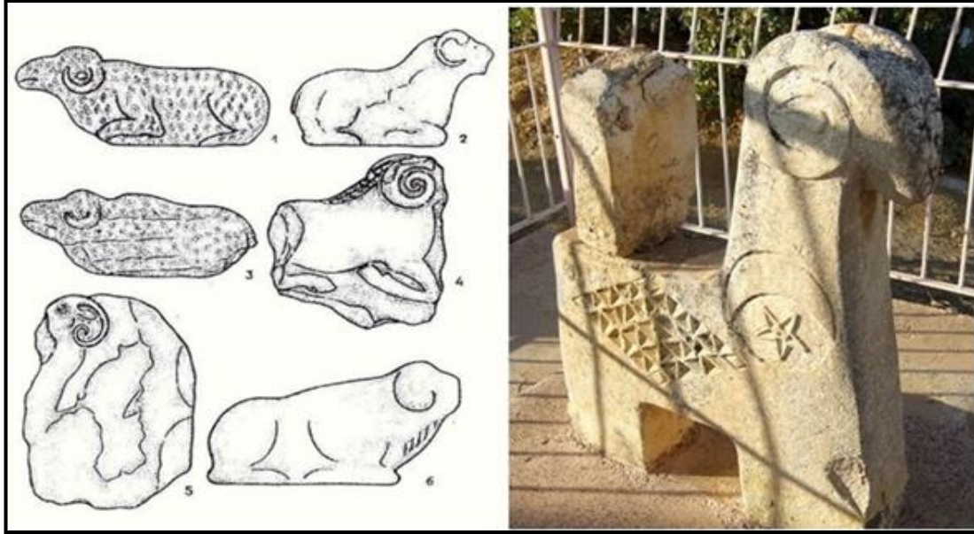
Görsel 15. Koç Heykel ve Figürleri ( https://www.kirmizilar.com/tr/index.php/bu-kitabi-okuyalim/437-tarihjin-sessiz-dili-damgalar Erişim Tarihi: 26.06.2018)