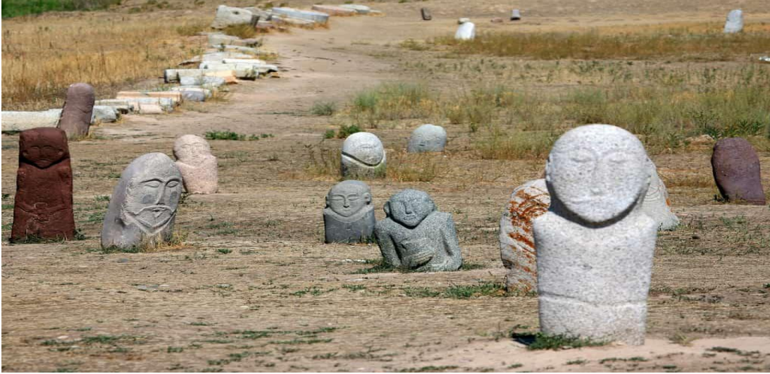
Görsel 18. Taş yontu bal bal örnekleri