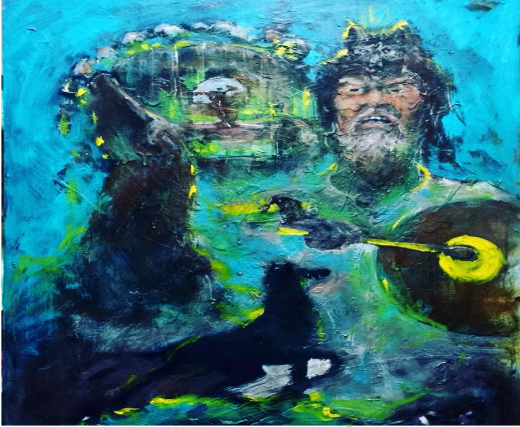
Görsel 4. Mehmet Sağ, isimsiz, 2018, 80x100 TÜYB ("Sanal", 2019)