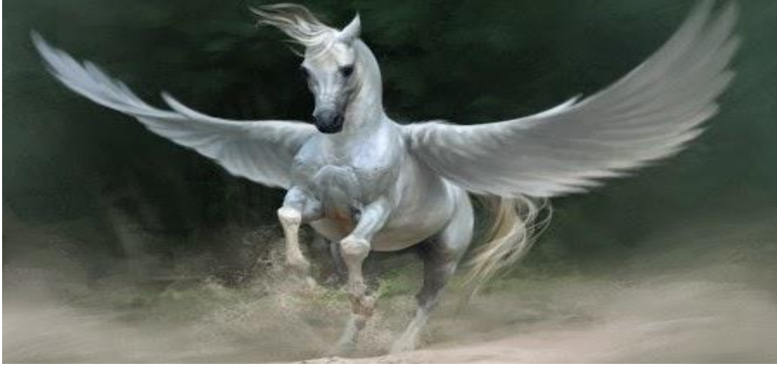
Görsel 12. Kanatlı At-Tulpar ( http://www.caglarerbek.com/2015/05/turk-mitolojisinde-kanatli-at-tulpar.html Erişim 26.06.2018)