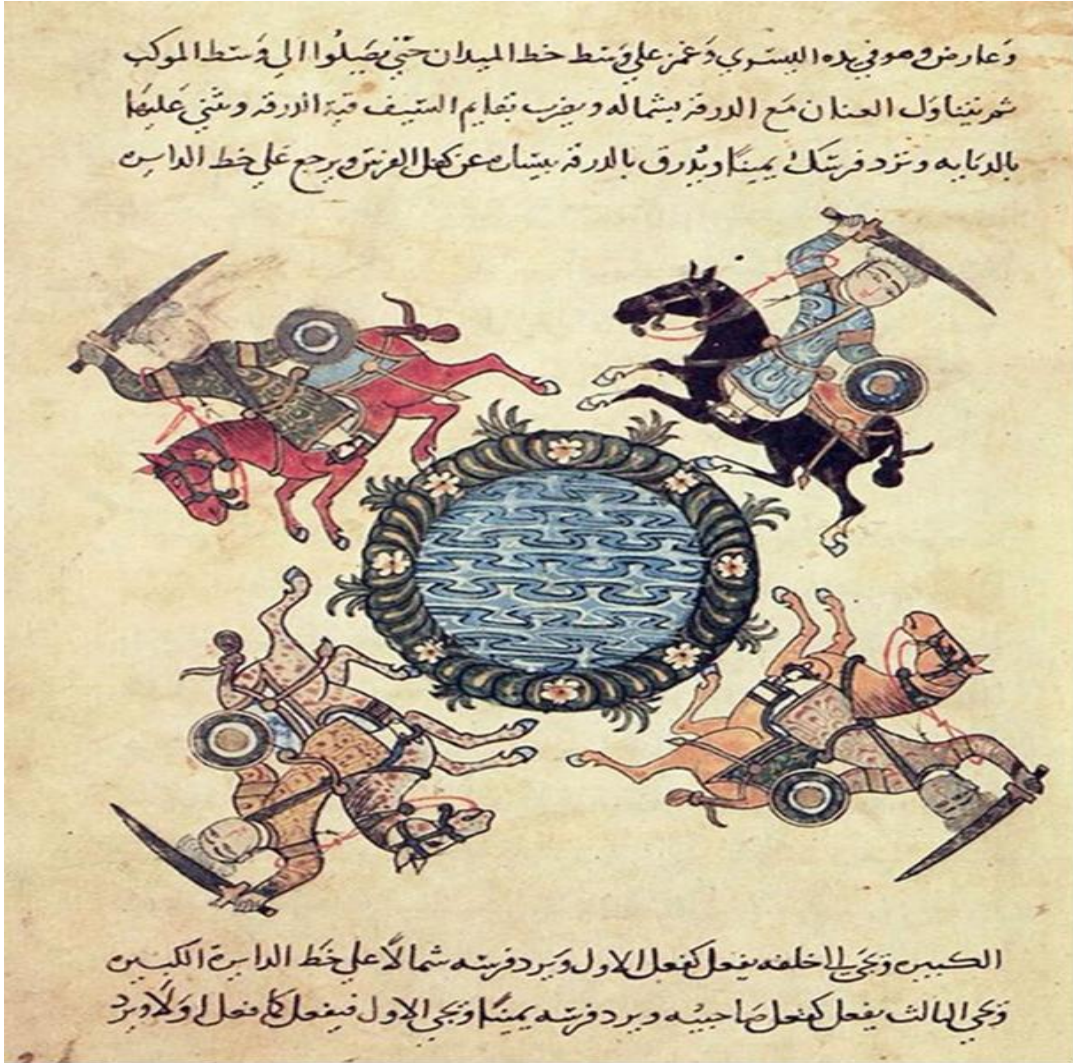
Görsel 3. Türklerde Dört Yön Sembolizmi ( https://haberayildiz.com/turk-kulturunde-kozmik-atmitolojisi/ Erişim: 21.06.2019)